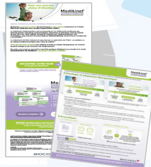
Posologie du produit du Laboratoire