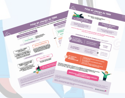
Prise en charge chez l'enfant et chez l'adulte