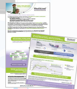
Pharmacovigilance du produit